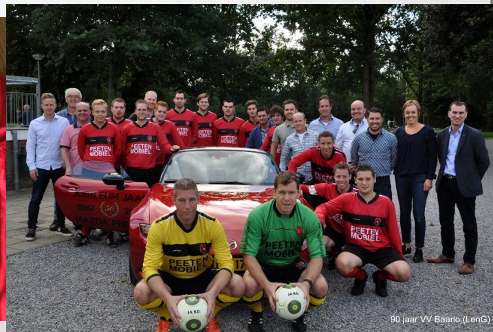
90 jaar VV Baarlo (LenG)