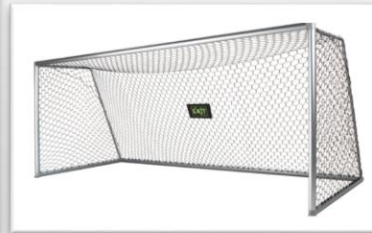
DOELEN 5 X 2M